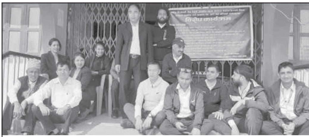
संघीय निजामती विधेयकमा आफ्ना मागहरू सम्बोधन गर्न माग गर्दै धर्नामा तानसेन नगरपालिकाका कर्मचारी ।

संघीय निजामती ऐनमा स्थानीय तहका कर्मचारीलाई विभेद गरिएको भन्दै काठमाडौं केन्द्रीत आन्दोलन गरेका कर्मचारीहरू अहिले ७ सय ५३ वटै स्थानीय तहमा आन्दोलित भएका छन् । उनीहरूले काठमाडौंको आन्दोलनलाई निरन्तरता दिँदै अहिले आ-आफ्ना पालिकाबाट समेत विरोध प्रदर्शन गरिरहेका छन् । जिल्ला-जिल्लामा संघर्ष समिति बनाएर आन्दोलन थालेका उनीहरूले शुक्रबारदेखि भने सम्बन्धित पालिकामा कामकाज रोकेर धर्ना बसेका हुन् ।