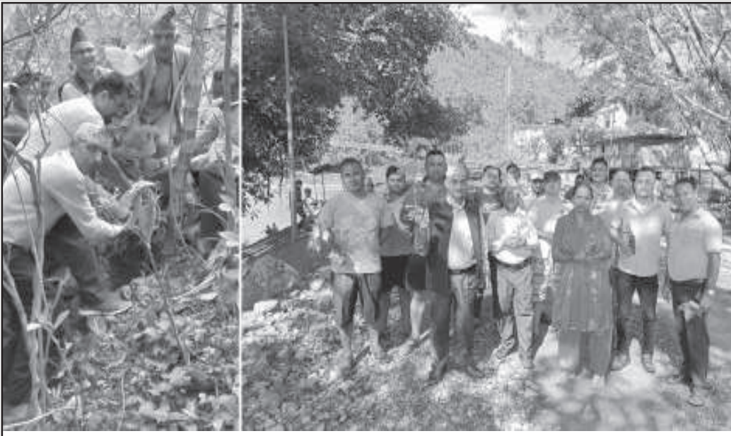
गुल्मीको सत्यवती गाउँपालिका - १ अस्लेवा र रुह क्षेत्र गाउँपालिका -१ रिडीको बिष्णु पञ्जरको भिरमा वृक्षारोपण तथा सरसफाई गर्दै नेपाली काँग्रेसका नेता तथा कार्यकर्ताहरू । ४१ औं बीपी स्मृति दिवसको अवसरमा नेपाली काँग्रेस गुल्मीले जिल्ला भर नै वृक्षारोपणसँगै सरसफाई गरेको छ ।