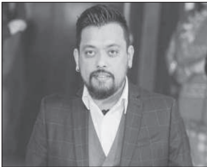
फिल्मलाई 'रङ्गेली'कै निर्माण समूहले बनाउन लागेको हो । आगामी वर्ष २०८२ को तीजमा फिल्म प्रदर्शन गर्ने तयारी गरिएको छ । फिल्मका लागि कलाकारहरू भने निश्चित हुन बाँकी रहेको निर्देशक सुवेदीले बताए । उनले यसअघि दुई सर्ट फिल्म 'लभ एट फर्स्ट

फिल्मको शीर्षक 'सोलिटी' जराइएको छ । निर्देशक सुवेदीका अनुसार, चलचित्र विकास बोर्डमा नाम दर्ता भइसकेको छ । फिल्म अन्तरजातीय प्रेमकथामा बन्ने उनको भनाई छ । आगामी साता पोस्टरमार्फत् फिल्मको घोषणा गरिने उनले बताए । छायांकन भने आगामी मंसिर ११ गतेबाट पूर्वी जिल्लामा हुने उनले जानकारी गराए ।