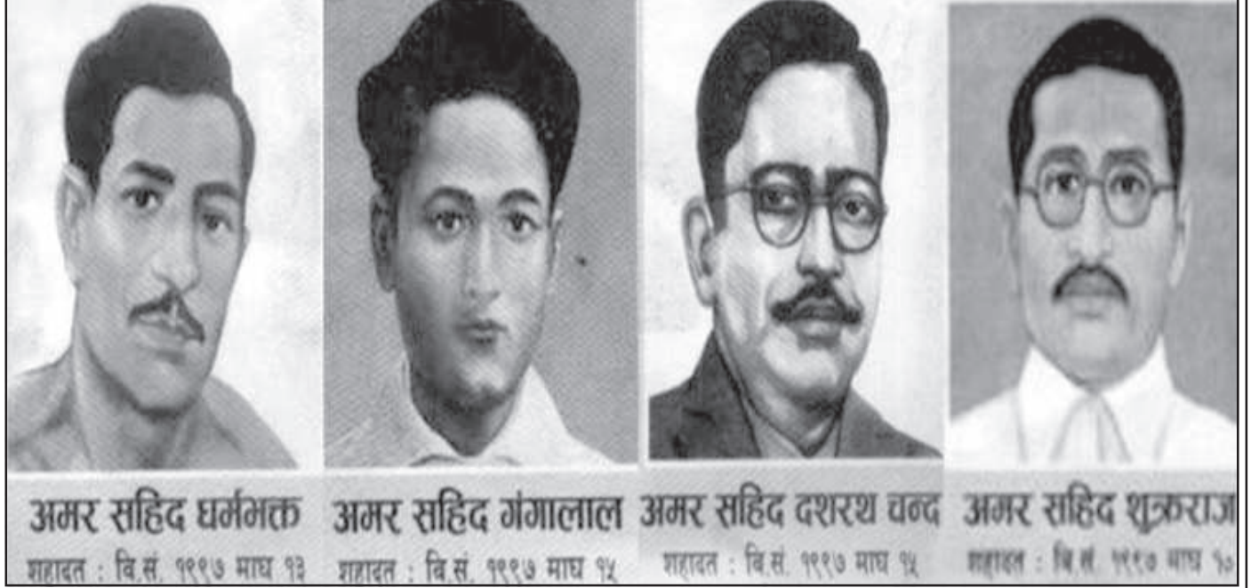
अमर सहिद धर्मभक्त शहादत : वि.सं. १९९७ माघ १३ | अमर सहिद गंगालाल शहादत : वि.सं. १९९७ माघ १५ | अमर सहिद दशरथ चन्द शहादत : वि.सं. १९९७ माघ १५ | अमर सहिद शुकुरराज शहादत : वि.सं. १९९७ माघ १६

विगतमा जस्तो भव्य रूपमा औपचारिकताका कार्यक्रमहरू नहुँदा दिवसकै उपहास भएको प्रति जिल्लाका सरोकारवालाहरूले चिन्ता व्यक्त गरेका छन् । अधिल्ला वर्षहरूमा माघ १६ गतेका दिन मुलुकभर नै विभिन्न संघ संस्थाहरूले सहिद प्रति दिप प्रज्वलन गरी दिवस मनाउने गरे पनि पछिल्ला केही वर्ष यता सामाजिक सञ्चालमा सहिदहरूको योगदानको चर्चा बाहेक