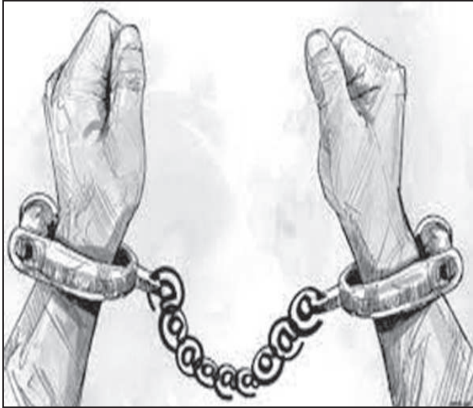
आदेशले कैद भुक्तानको लागि जिल्ला प्रहरी कार्यालय स्याङ्जाले जनाएको कारागार स्याङ्जामा पठाइएको जिल्ला छ ।

उनलाई फौसला कार्यान्वयनको लागि स्याङ्जा जिल्ला अदालतमा पेश गरिएकोमा अदालतको