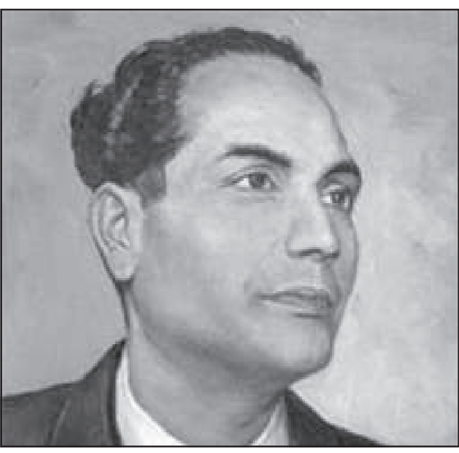
उपहासको रूपमा लिनु, मूर्तिपूजा, संस्कार

यी हरफहरूका कारण उनलाई मन्दिर र मूर्तिपूजाविरोधी मानियो । भारत प्रायद्वीपका केही राज्यमा सात सय वर्ष मुगल शासन थियो । त्यसपछि पालो आयो, इसाई ब्रिटिस शासनको । इस्ट इन्डिया कम्पनीले आफ्ना सामान बिक्री गर्न भारतका अनेक राज्यलाई गाँभ्दै गए र एउटा विशाल राष्ट्रको निर्माण गरे जसलाई उनीहरूले इन्डिया नामकरण गरे । यसरी एक हजार वर्षसम्म कहिले इस्लाम त कहिले इसाई धर्म र शासनबाट आक्रान्त भयो । यी सबै कारणले गर्दा भारतमा हिन्दू धर्मको विरोध व्यापकरूपमा भएको पाइन्छ । हिन्दू देवदेवीहरूलाई