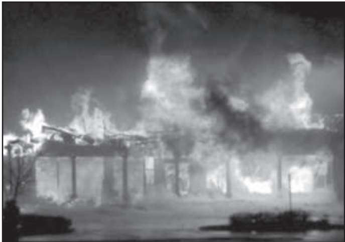
६० लाख ३८ हजार पाँच सय बराबरको क्षति भएको जिल्ला प्रहरी कार्यालय

चालु आवको हालसम्म ११ घर र १९ गोठमा आगलागी भएको छ । गत आवमा ३१ घर र १५ गोठ एवं आव २०७६/७७ मा ११ घर र १५ गोठ जलेको जिल्ला प्रहरी कार्यालय गुल्मीले जनाएको छ । आगलागीबाट तीन वर्षमा तीन करोड