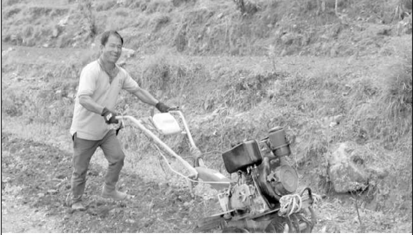
हाते द्याक्टरबाट बारी जोत्दै पाल्पा पूर्वखोला -२ जल्पाका किसान ।